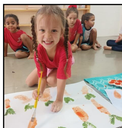
META 6: Garantir a qualidade do processo de ensino aprendizagem pelo monitoramento, acompanhamento e avaliação do coordenador pedagógico.