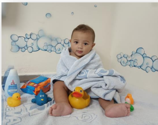
Sala: Berçário I - Bebês