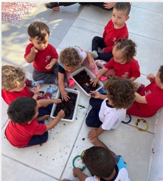
Sala: Berçário I - Bebês

Além de garantir a higiene do bebê, o banho também proporciona uma oportunidade única para fortalecer os laços afetivos e estimular o desenvolvimento sensorial.