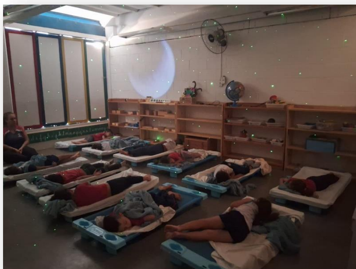
Sala: Infantil I - A Crianças Pequenas

O contato com a natureza desperta diversos estímulos na criança, proporcionando maiores possibilidades de criar, recriar, inventar, imaginar, descobrir e sentir. Esta atividade oportuniza exploração livre de materiais diversos e múltiplas possibilidades de envolvimento e interação, conforme as preferências das crianças.