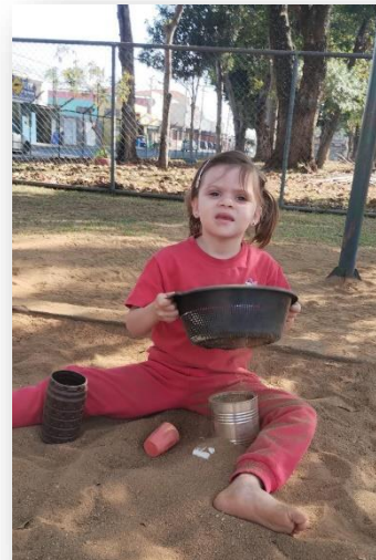
Sala: Infantil I B - Crianças Pequenas

Proposta de experiência na área externa: Parque - Com materiais de largo alcance